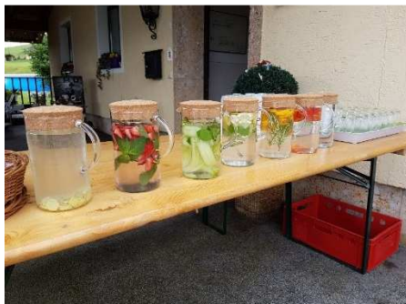
Wasser in verschiedene Geschmacksrichtungen

Am Freitag, 23. Juni, fand zum zweiten Mal der österreichweite "Trink`Wassertag" statt. Dieser wurde im Vorjahr von der Österreichischen Vereinigung für das Gas und Wasserfach (ÖVGW) ins Leben gerufen. Er soll ins Bewusstsein rufen, welch hohen Wert eine sichere und störungsfreie Wasserversorgung hat. Für Wasserversorgungsunternehmen in ganz Österreich ist dies der Anlass, der Bevölkerung ihre Leistungen zu präsentieren. Zu diesem Anlass hat das Team des Reinhalteverbandes Tennengau Nord den Brunnen in Hallein-Gamp für die Bevölkerung geöffnet. Unter dem Motto "Wo kommt unser Trinkwasser her?" konnte zwischen 10.00 und 18.00 Uhr der Brunnen Gamp I (Gamberstraße Süd 12) besichtigt werden. Von dort aus ging es dann weiter zum Brunnen Gamp II sowie zum Hochbehälter Adneter Riedl.