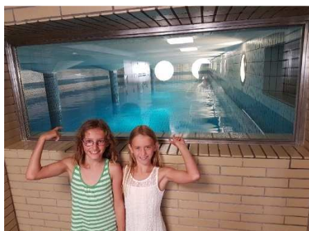
Hochbehälter Adneter Riedl