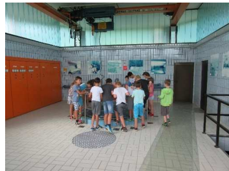
Eine Schulklasse mit Blick in den Brunnen Gamp II